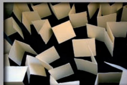
Abb. oben grüne felder nr. 1, 2010, Unikat

Teilnahme an zahlreichen internationalen und nationalen Ausstellungen; private und öffentliche Ankäufe.