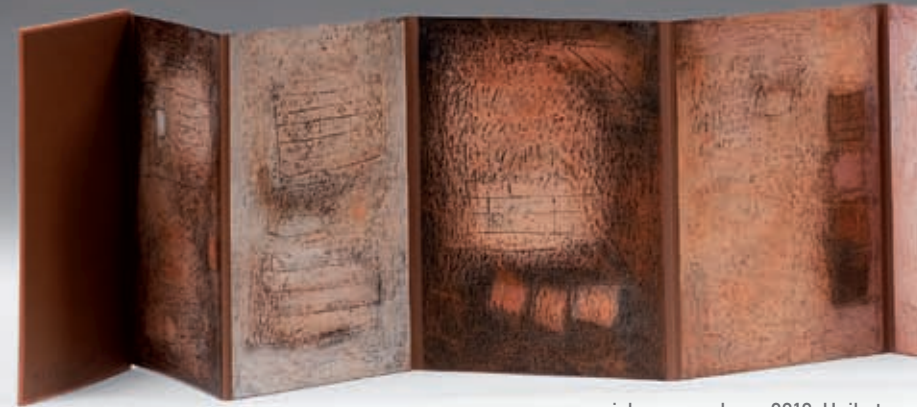
zeichensammlung, 2010, Unikat