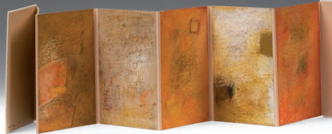
cahier du sud numéro 2, 2010, Unikat