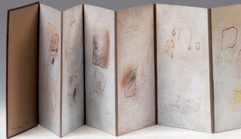
farbzeichen & spuren II, 2010, Unikat